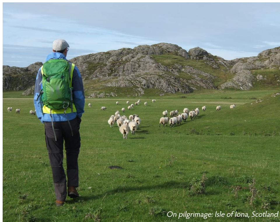
On pilgrimage: Isle of Iona, Scotland